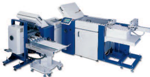
Die Falzmaschine prestigeFold Net 52 – ebenfalls vollautomatisch vom Anleger bis zur Auslage.