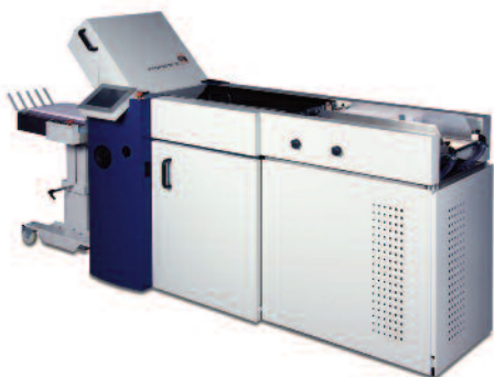
Die vollautomatische Falzmaschine prestigeFold Net 38 mit Unterflursauganleger PBA.

Der Kundennutzen, der sich aus der Verknüpfung sämtlicher betrieblicher Abläufe realisieren lässt, wie zum Beispiel Verkürzung der Produktionszyklen, Verbesserung der Qualitätskontrolle oder Verringerung der Makulatur, wird bei MB Bäu­erle anschaulich demon­striert werden. Neben der prestigeFold Net 38