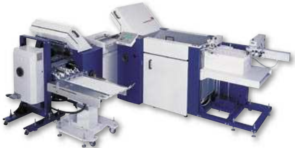
Die prestige FOLD NET 52 von MB Bäuerle ist eine vom Anleger bis zur Auslage vollautomatische Falzmaschine, die eine Umstellung per Knopfdruck ermöglicht und über einige Zusatzeinrichtungen verfügt.

Der Digitaldruck, der bei sehr individuellen und kleinen Druckaufträgen sowie beim Drucken nach Bedarf angewandt wird, zeichnet sich durch seine schnelle und flexible Fertigung