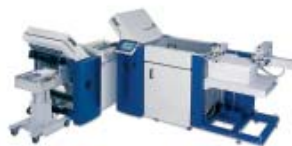
NET 52/4/4 SKM 36