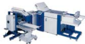
NET 52/4/4/MS 45