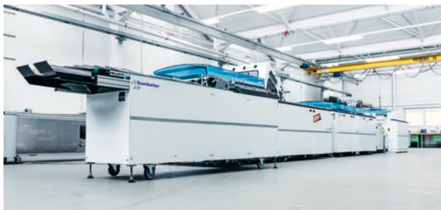
Hunkeler-Zeitungsline mit Falz- und Sammelmodul FC7.

Informationen: www.guk-falzmaschinen.com