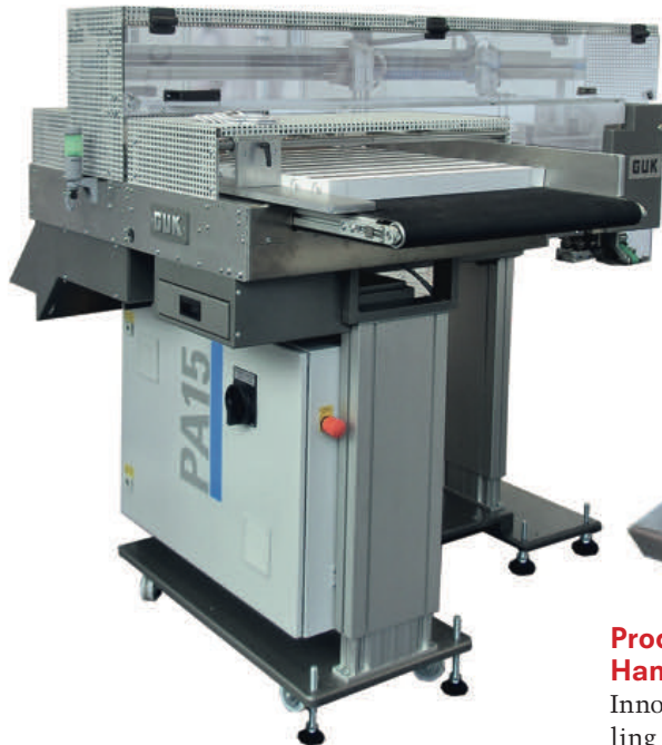
Booklet-Anleger Auto-Pack PA15 mit Track & Trace-Modul.

Das Unternehmen GUK-Falzmaschinen aus Wellendingen/Rottweil stellt System-Neuheiten in den Bereichen Pharma Folding und Product Handling vor.