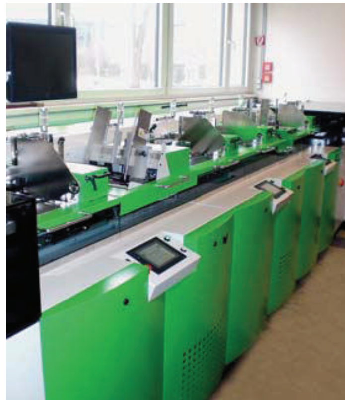
Das bereits vorhandene Kuvertiersystem AutoSET B4 verfügt über sechs Beilagenstationen mit unterschiedlichen Beilagenanlegern zur Verarbeitung eines breiten Materialspektrums.

Um die klassischen Lettershop-Dienstleistungen wie zum Beispiel Kuvertieren, Folieren, Beilagen einstecken, Falzen, Schneiden möglichst effizient durchführen zu können, stand der Austausch eines der drei vorhandenen Kuvertiersysteme an. Vor zwei Jahren investierte man bei BC bereits in die Multifformat-Hochleistungskuvertiermaschine AutoSET B4 von MB Bäuerele. „Das System hat uns voll überzeugt. Besonders im Hinblick auf den hohen Output in Verbindung mit den geringen Wartungs- und Serviceaufwendungen ist die AutoSET B4