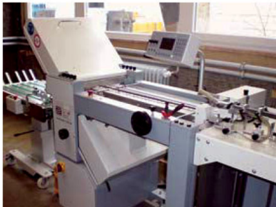
Auf zwei automatisierten Falzmaschinen der Baureihe Multi-master CAS 38 werden normale Falzaufgaben sowie die Herstellung von Self-mailern erledigt.

unschlagbar. Wir haben immer mehr Kunden, deren Aussendungen in einem vorgegebenen Zeitfenster kuvertiert werden müssen. Somit galt es im Rahmen einer Ersatzinvestition unsere Kapazitäten zu erhöhen. Auch sollte die neue Maschine als leistungsfähiges Backupsystem für die AutoSET B4 zur Verfügung stehen und ebenso für die Verarbeitung von Transaktionsdokumenten (Rechnungen, Mahnungen) konzipiert sein. Aufgrund der guten Erfahrungen mit dem Kuvertiersystem aus dem Hause Bäuwerle haben wir uns deshalb für die AutoSET 18 entschieden“, erläutert Guido Bethge die Hintergründe für die Investition.